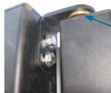
Pivots centraux Ø 25

Vantail entièrement fabriqué en alliage d'aluminium et assemblé par soudure. Montants en tube rectangulaire 87x60. Traverses en tube carré de 60x60. Pivots Ø25 réglables dans les 2 sens. Visserie et boulonnerie en inox. Condamnation par serrure encastrée avec cylindre européen hors combinaison et béquille double. Poteaux en alliage d'aluminium 125x125 à sceller. Joint de finition noir. Choix du modèle suivant Catalogue gamme Alu.