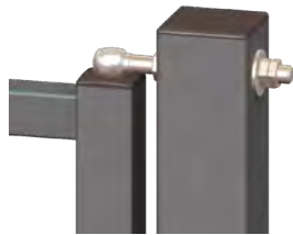
PIVOT Ø14 MM

Cadre en tube d'acier carré assemblé par soudures avec interpénétration des barreaux et galvanisé à chaud. Montants 50x50 Traverses 40x40 Barreaux 25x25 espacement de 110 mm. Poteaux en tube carré de 80x80. Fermeture par serrure de grille à cylindre européen Pivots réglables Ø14, en acier galvanisé. Verrouillage anti soulèvement sur les portails