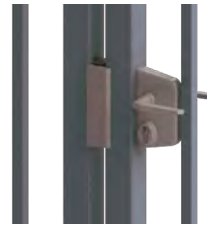
SERRURE DE GRILLE