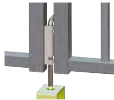
VERROU ANTI SOULÈVEMENT